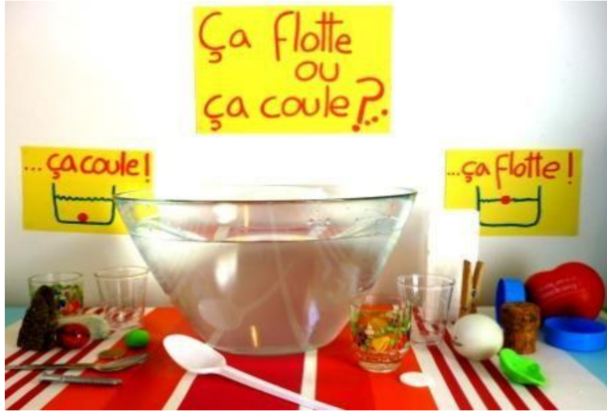
L'eau, l'air, la terre..

Si vous inscrivez votre enfant au TAP « Temps libre » vous serez libre de venir le chercher dans son école entre 16h et 16h30.