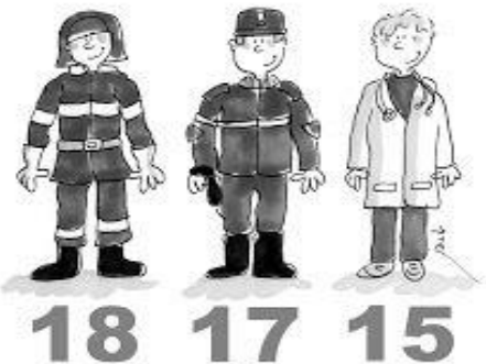
Au feu les pompiers