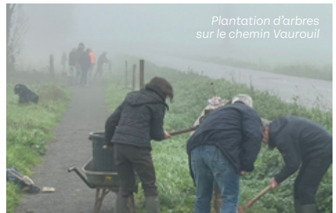
Plantation d'arbres sur le chemin Vaurouil

Paniers de produits locaux le jeudi après-midi : leclicdeschamps.com